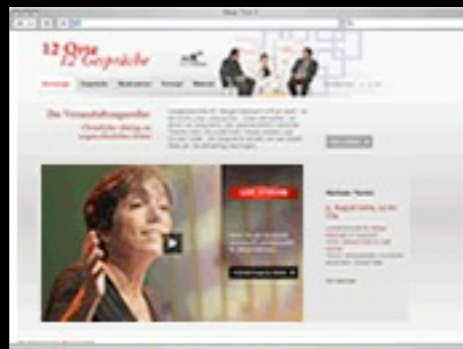
12 Orte, 12 Gespräche