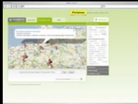
Evangelisch in Niedersachsen